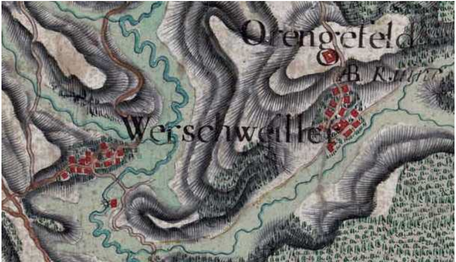
Abb. 1: Werschweiler auf der Naudin-Karte von 1737